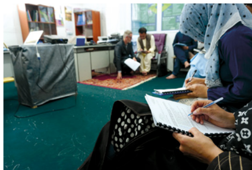
Des séminaires spéciaux ont été proposés aux entrepreneuses et entrepreneurs locaux.

Malgré le Corona, neuf expatriés ont reçu un enseignement en ligne dans la langue et la culture, par quatre assistants linguistiques locaux – qui ont donc également reçu une formation et un travail. Trois personnes locales ont été promues à des postes de direction.