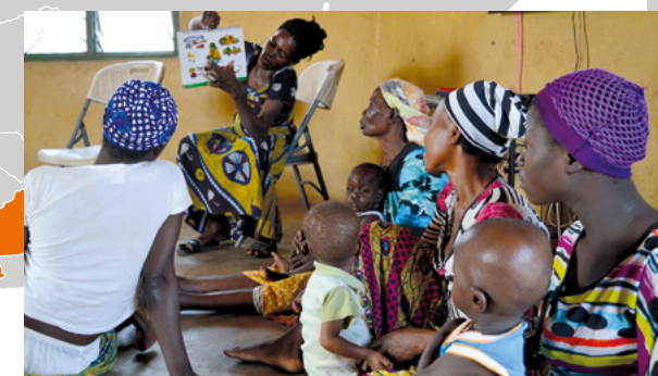
Une leçon sur la nutrition au Ghana.