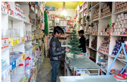
La promotion des micro-entreprises est très importante en Asie du Sud en raison du taux de chômage élevé.

Des séminaires spéciaux ont été proposés aux employés locaux de diverses organisations d'entraide ou de petites entreprises locales. 100 étudiants locaux ont participé aux cours d'anglais. Douze enseignants locaux ont été engagés et formés et neuf enseignants anglais ont été formés.