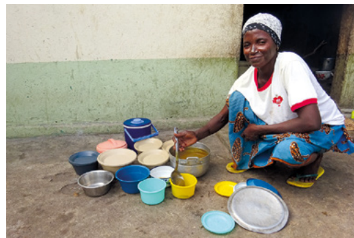
La malnutrition infantile au Ghana est évitable.

55 enfants ont été traités et leurs mères instruites, ce qui représente plus d'un tiers de moins que l'année dernière – probablement en raison du Corona et d'une diminution des transferts de l'hôpital public. Après leur sortie de l'hôpital, 39 enfants ont pu être visités dans 18 villages différents pour prévenir les rechutes. Un programme de sensibilisation a été lancé dans un village.