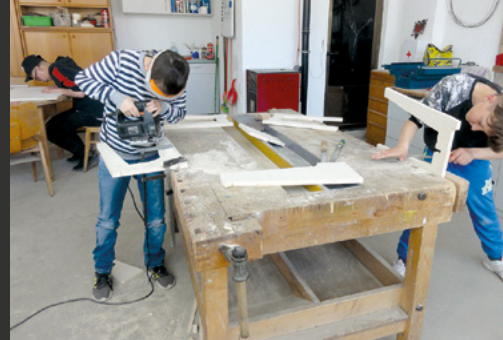
L'école professionnelle ALiVE a été remise dans des mains locales.