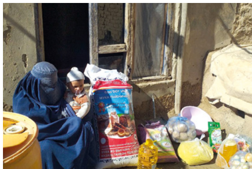
Une veuve en Asie du Sud reçoit de la nourriture durant la crise du Corona.

En Asie du Sud, notre personnel d'une petite ville a également distribué de la nourriture à environ