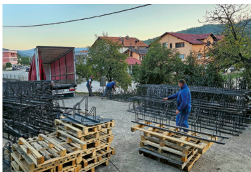
Les supports à vélos sont chargés pour le transport vers la Suisse.