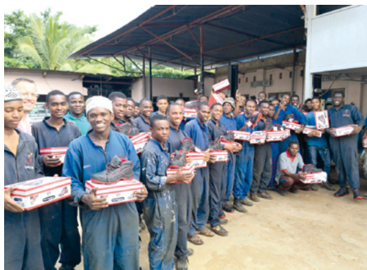
Remise de chaussures de sécurité au personnel.

De nouvelles obligations imposées par le gouvernement aux ONG nous ont amenés à abandonner la formation de mécanicien fin 2023. Ce domaine a été confié à un institut local qui poursuit le même objectif.