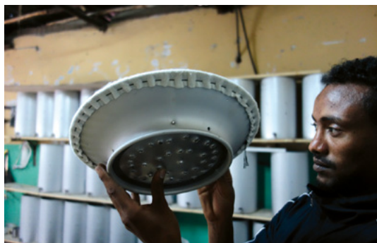
Remise d'un filtre dans la région du Tigray, au nord de l'Éthiopie.

Minch emploie onze collaborateurs locaux. La production emploie principalement des personnes socialement défavorisées ou physiquement handicapées. En 2023, trois employés malentendants, une jeune femme issue d'un centre d'hébergement temporaire et quatre membres de l'équipe dirigeant ont été embauchés.