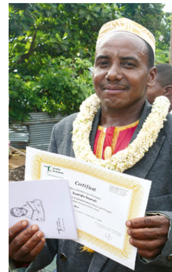
Heureux de recevoir son diplôme de niveau 3.

Afin d'améliorer les compétences en lecture et en écriture dans les écoles, des enseignants volontaires ont été formés pendant un an. En 2023, cinq enseignants, donnant des cours à environ 240 élèves, ont accepté cette offre.