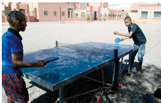
Jeu de ping-pong en plein air.

En 2023, neuf classes ont été organisées avec 252 enfants sur six sites différents. 40% d'entre eux sont des filles. Les panneaux solaires nouvellement installés sont utilisés pour les cours d'informatique et pour l'éclairage électrique. Une ancienne tente a été remplacée. Huit filles et six garçons de l'école mobile ont passé le baccalauréat en 2023. Certains avec les meilleures notes de toute la province.