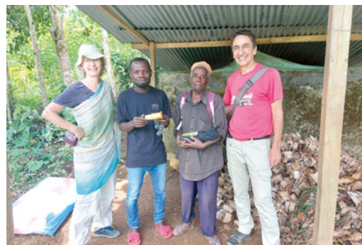
Le couple de responsables avec deux collaborateurs locaux, à gauche, le nouveau chef de projet.

Cette année, nous avons eu des difficultés avec les semis et la récolte. Malgré cela, nous avons environ 900 traitements d'Artemisia en stock. Environ 1100 traitements ont été distribués. La responsabilité du projet a désormais été confiée à un autochtone et à ses partenaires locaux.