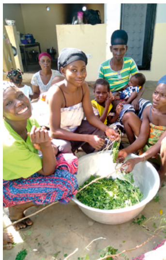
Des femmes préparent un repas sain.

Dans un village, un programme de sensibilisation a déjà été mis en œuvre et évalué avec succès depuis trois ans. En raison de ce succès, il est prévu de mener ce programme dans d'autres villages à l'avenir.