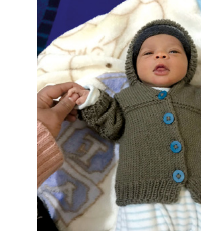
Un des plus petits qui a pu bénéficier des contrôles postnataux.