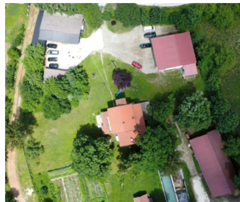
L'exploitation modèle Susret vue du ciel : en haut à gauche, la halle des machines ; à droite, l'atelier de machines agricoles ; au milieu, la maison d'habitation ; en bas à droite, l'étable.