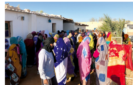
Files d'attente pour les inscriptions des cours d'anglais.

En raison de la pandémie, les responsables de projet ont été longtemps absents. Pendant cette période, les classes ont continué à fonctionner à un faible niveau. Cela a conduit à une restructuration en 2023 et à l'introduction d'un nouveau règlement et de contrats pour tous les collaborateurs locaux.