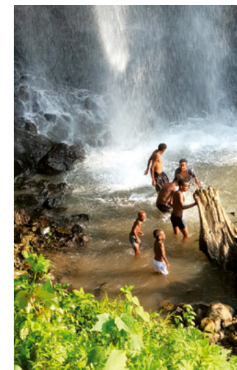
Excursion à la cascade.

Il y a des capacités et de la place pour accueillir d'autres enfants. Malheureusement, les moyens financiers font défaut. La sécurité dans le pays s'est détériorée et le coût de la vie a encore augmenté.