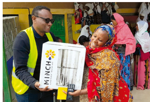
Distribution de filtres à eau Minch dans le Tigré.

Après le renversement du gouvernement en été 2021, la situation humanitaire s'est aggravée dans le pays. En 2023, des actions d'urgence ont donc été poursuivies régulièrement sur une base mensuelle dans deux régions isolées. Environ 2000 familles vulnérables, menacées par la malnutrition et la pauvreté, ont pu en bénéficier. Parmi elles, 375 foyers dirigés par des mères célibataires et environ 600 familles déplacées. Cette action ciblée se poursuivra en 2024.