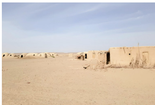
Un des villages qui a reçu de l'aide.