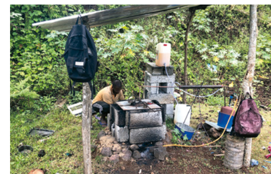
Production de carburant à partir de déchets plastiques par pyrolyse.

En 2023, la nouvelle direction du projet a pris le relais. Au cours du second semestre, les activités avec la presse et l'extrudeuse ont repris et ont été partiellement améliorées. On travaille au développement et à l'essai d'un appareil de pyrolyse pour transformer les matières plastiques en carburant. Les réactions de la population et du marché ont été très positives. L'acquisition d'un nouveau prototype pas cher de taille moyenne, robuste et efficace, est nécessaire.