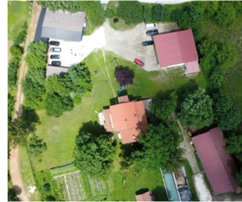
L'exploitation modèle Susret vue du ciel : en haut à gauche, la halle des machines ; à droite, l'atelier de machines agricoles ; au milieu, la maison d'habitation ; en bas à droite, l'étable.

« Un agriculteur s'est plaint auprès de moi de la faible production laitière de ses vaches et de leurs problèmes de fertilité. Je lui ai montré qu'il leur donnait trop peu de protéines. Après le changement d'alimentation, les vaches ont donné plus de lait et sont redevenues portantes. »