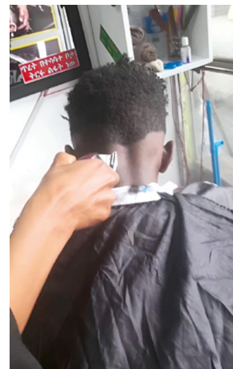
Formation dans un salon de coiffure.

Un recueil de poèmes de différents auteurs et un recueil d'histoires sur des initiatives d'entraide telles qu'une maison d'accouchement ou la prise en charge de lépreux sont actuellement en cours d'élaboration. En outre, deux concours de poésie ont été organisés, dont un pour la première fois dans le Sud. Plusieurs centaines de visiteurs ont assisté à ces manifestations.