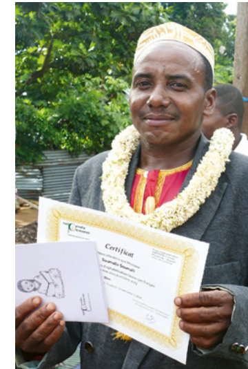
Heureux de recevoir son diplôme de niveau 3.

Afin d'améliorer les compétences en lecture et en écriture dans les écoles, des enseignants volontaires ont été formés pendant un an. En 2023, cinq enseignants, donnant des cours à environ 240 élèves, ont accepté cette offre.