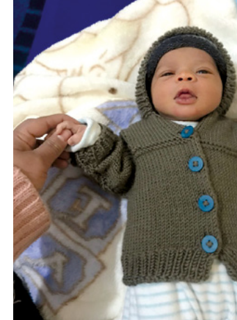
Un des plus petits qui a pu bénéficier des contrôles postnataux.