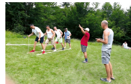
Des activités de loisirs sont régulièrement proposées. Elles sont très appréciées.