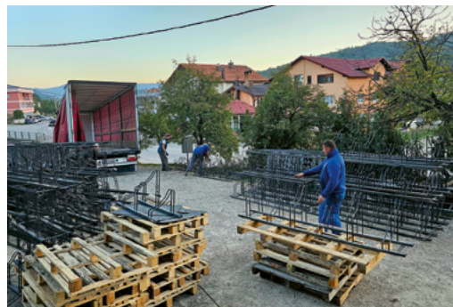
Les supports à vélos sont chargés pour le transport vers la Suisse.