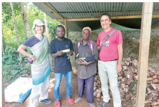
Le couple de responsables avec deux collaborateurs locaux, à gauche, le nouveau chef de projet.

Cette année, nous avons eu des difficultés avec les semis et la récolte. Malgré cela, nous avons environ 900 traitements d'Artemisia en stock. Environ 1100 traitements ont été distribués. La responsabilité du projet a désormais été confiée à un autochtone et à ses partenaires locaux.