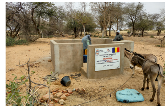
Le puits achevé à Doudou est en service.

« Après avoir discuté du nouveau programme d'électropompes avec le chef de la région, celui-ci a été très enthousiaste. Il a immédiatement cité l'un des villages environnants qui, selon lui, devrait également en bénéficier. »